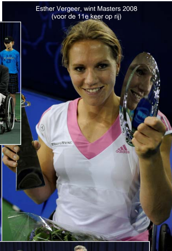
Esther Vergeer, wint Masters 2008 (voor de 11e keer op rij)